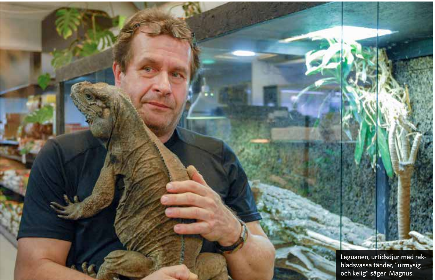
Leguanen, urtidsdjur med rakbladsvassa tänder, "urmysig och kelig" säger Magnus.