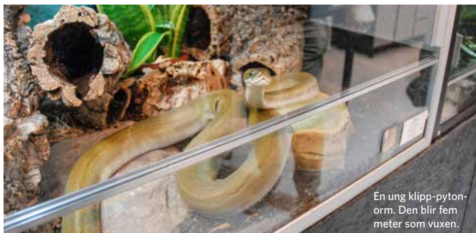
En ung klipp-pytonorm. Den blir fem meter som vuxen.

nattaktiv och när barnen kommer hem ligger de och sover. Är du tolv år och har en ödla så vill du ju på något sätt interagera med den. Men det är viktigt att få med sig att vi inte ska väcka och störa djur, utan agera tillsammans med dem. Och så är det ju för guldhamstrar och andra smådjur också.