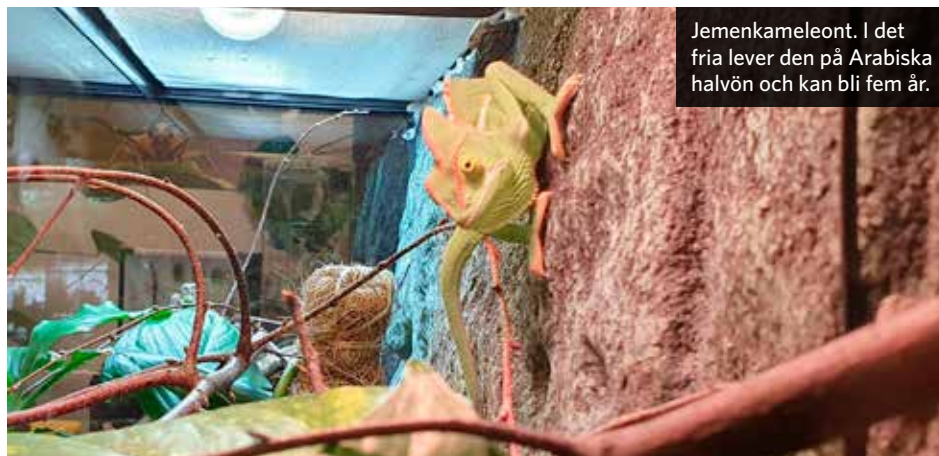
Jemenkameleont. I det fria lever den på Arabiska halvön och kan bli fem år.

– Här måste vi i butik ta stort ansvar. Det kan vara en förälder som kommer in och säger att nu är mina barn tolv år och jag skulle vilja ge dem en leopardgecko. Då måste jag berätta att leopardgeckon är