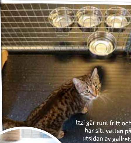
Izzi går runt fritt och har sitt vatten på utsidan av gallret.