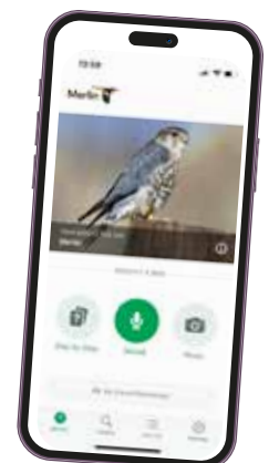
Merlin – en hyfsat god fågelskådarkompis.