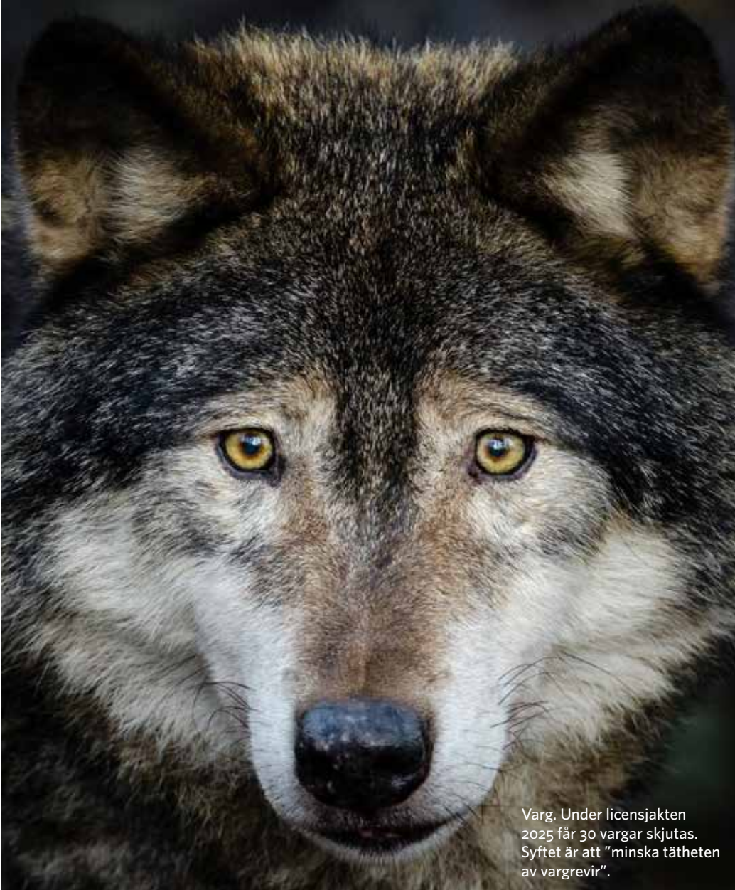
Varg. Under licensjakten 2025 får 30 vargar skjutas. Syftet är att "minska tätheten av vargrevir".

För få vargar innebär att inaveln ökar. Livskraften försämras. Samtidigt angrips tamdjur, främst får. Fast fler vargar betyder inte fler angrepp, en varg kan stå för många angrepp, sa forskaren Jens Frank, vid SLU Viltskadecenter, i en SVT-intervju i somras. Rovdjursavvisande stängsel är ett sätt att skydda djuren.