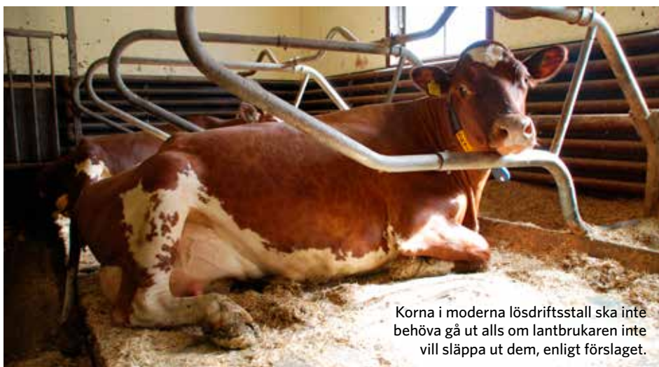
Korna i moderna lösdriftsstall ska inte behöva gå ut alls om lantbrukaren inte vill släppa ut dem, enligt förslaget.