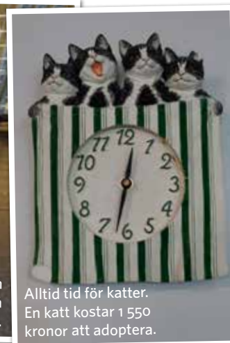
Alltid tid för katter. En katt kostar 1 550 kronor att adoptera.