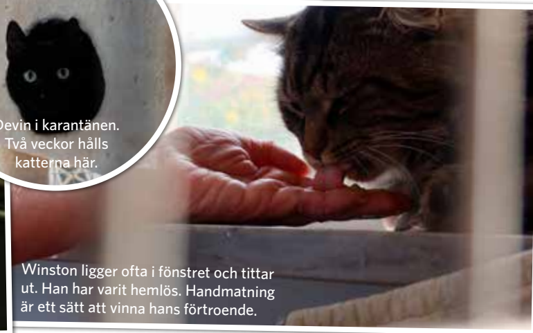
Winston ligger ofta i fönstret och tittar ut. Han har varit hemlös. Handmatning är ett sätt att vinna hans förtroende.

Opererade benet, samt några tandsaner- ringar. Annars går föreningen runt på "en himla massa vilja" och pengar via generösa donatorer. Några har stående månads- överföringar. Ica Maxi dubblar varje år juli månads pant och skänker till katthemmet. Därtill kommer arv in ibland. Lotteriet och loppisar drar in en del pengar, men främst håller de verksamheten igång genom sitt eget hårda arbete.