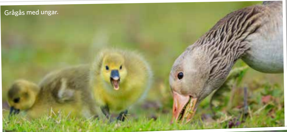
Grågås med ungar.